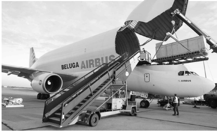
Aufnahmebericht: Das Spezialflugzeug „Beluga“ des Airbus-Konzerns im Einsatz in Berlin. Der Einstieg von Finanzinvestoren bei Airbus könnte möglich werden

Die Deutsche Post kommt bei der Sicherung ihres US-Expressgeschäfts schneller voran als geplant. Die US-Tochter könne die Gewinnzone in den USA in zwei bis drei Jahren - also frühestens 2008 - erreichen, sagte der zuständige Vorstand John Mullens gestern vor Investoren in New York. Bislang galt 2008 als das Jahr, in dem die schwächelnde Sparte die Gewinnzone erreichen soll. Gegenüber 2005 hätten sich die Verluste in der zweiten Jahreshälfte um 150 bis 200 Mio. $ verringert, sagte Mullens. In Europa und Asien laufe das Express-Geschäft 2006 zudem besser als geplant. Der Aktienkurs der Post legte nach Mullens Aussagen deutlich zu und stieg zeitweise um 3,8 Prozent auf 23,40 €. Langfristig stelle der Vorstand für das US-Geschäft eine Umsatzrendite von drei bis fünf Prozent in Aussicht - deutlich weniger als die Konkurrenten UPS und FedEx. REUTERS