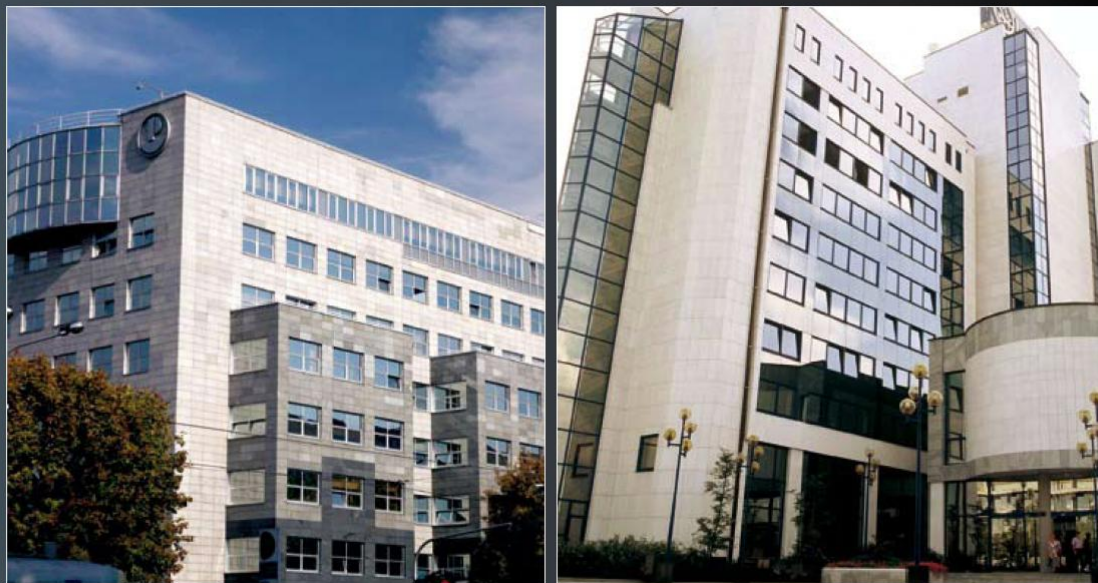
U Hrvatskoj i Sloveniji najveća su preuzimanja bila u farmaceutskoj industriji: Barr je platio Plivu 2,4 milijarde dolara, a Novartis je za Lek dao 851,3 milijuna dolara

Rumunjska i Bugarska. U te prve četiri zemlje izvršilo se gotovo tri četvrtine svih akvizicija u regiji. Tržišni udjel Grčke ipak kontinuirano