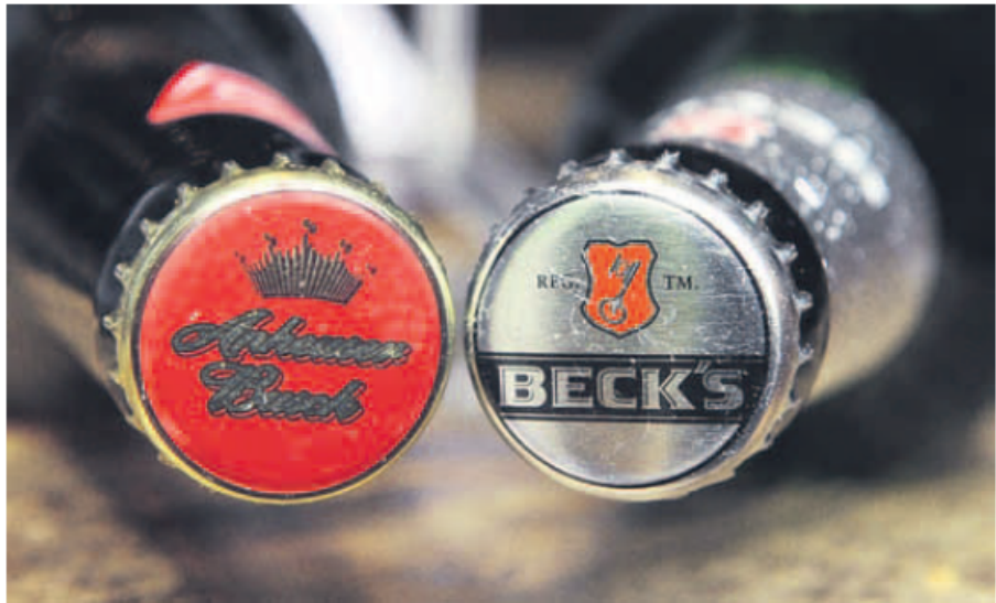
Kräftiger Schluck: Nicht nur Bierbrauer Inbev nutzt den im Verhältnis zum Euro günstigen Dollar zum Firmenkauf in den USA.

Aber nicht nur deutsche Firmen sind gerade in Kauflaune. „Die Zahl der Übernahmen europäischer Unternehmen in